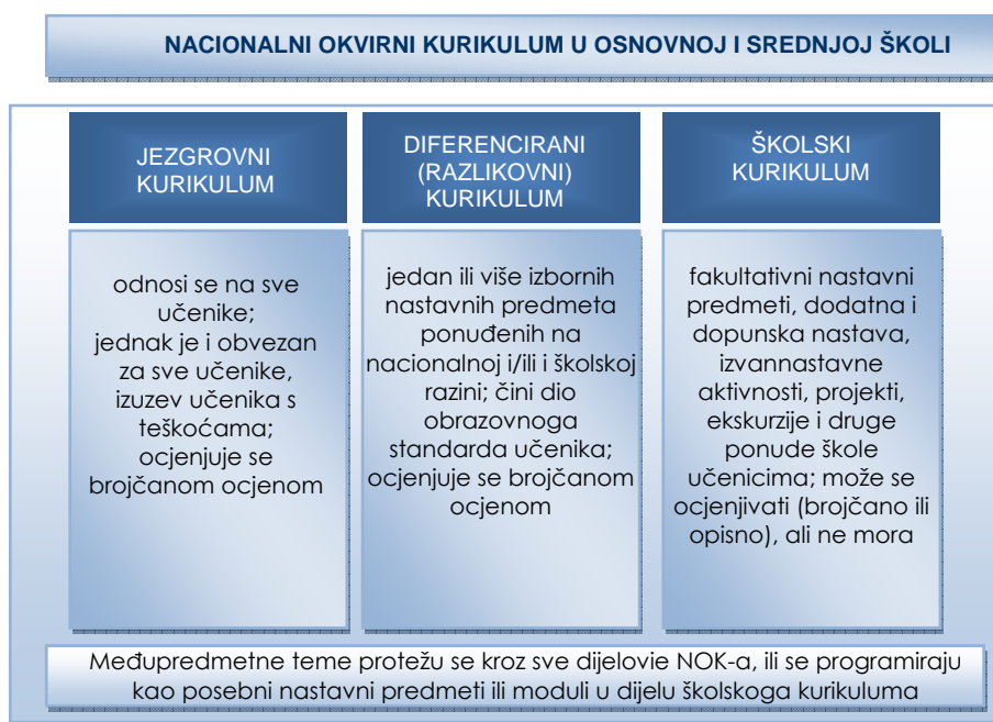
Slika 3. Struktura nacionalnoga kurikuluma u osnovnoj i srednjoj školi

Vodeći se znanstvenim istraživanjima, suvremenim obrazovnim pravcima te polazeći od odredaba Strategije za izradbu i razvoj nacionalnog kurikuluma za predškolski odgoj, opće obvezno i srednjoškolsko obrazovanje (2007.), Mjera za uvođenje obveznoga srednjega obrazovanja u RH (2007.) i čl. 27. Zakona o odgoju i obrazovanju u osnovnoj i srednjoj školi (2008.) Nacionalni okvirni kurikulum pretpostavlja kurikulumsku strukturu jednaku u osnovnoj i srednjoj školi. On se sastoji od jezgrovnoga, diferenciranoga ili razlikovnoga i školskoga kurikuluma (slika 3).