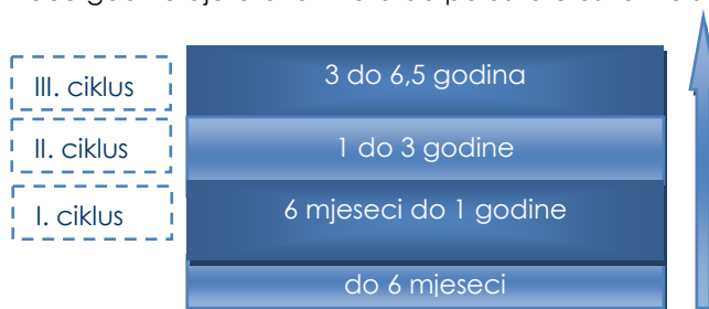
Slika 1. Odgojno-obrazovni ciklusi predškolskoga odgoja i obrazovanja

U skladu s vrijednostima, općim ciljevima i načelima Nacionalnoga okvirnoga kurikulumu težište odgojno-obrazovne djelatnosti tijekom predškolskoga odgoja i obrazovanja usmjereno je na poticanje cjelovita i zdrava rasta i razvoja djeteta te razvoja svih područja djetetove osobnosti: tjelesnoga, emocionalnoga, socijalnoga, intelektualnoga, moralnoga i duhovnoga, primjereno djetetovim razvojnim mogućnostima.